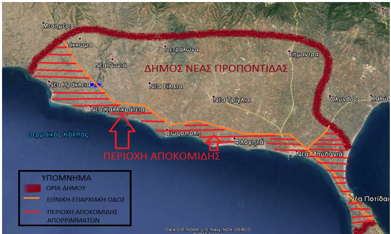
Εικόνα 1. Παραλιακή ζώνη αποκομιδής αστικών στερεών απορριμμάτων

Τα σημεία συλλογής των ΑΣΑ είναι οι πράσινοι κάδοι διαφόρων διαστάσεων (κυρίως χωρητικότητας 1.100lt) οι οποίοι είναι τοποθετημένοι στις παρακάτω διαδρομές της παραλιακής ζώνης. Η εναπόθεση των απορριμμάτων θα γίνεται στον ΧΥΤΑ Ανθεμούντα.